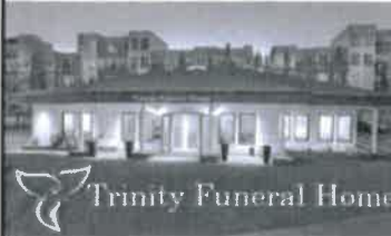
Trinity Funeral Home

Posseduto ed operato dalla famiglia Smolyk dal 1941.